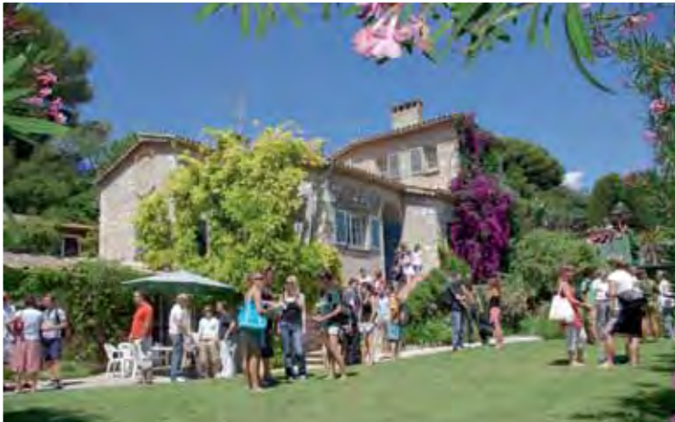
Schule in Antibes