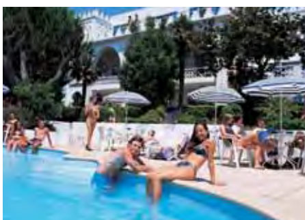
Residenz Castel Arabel