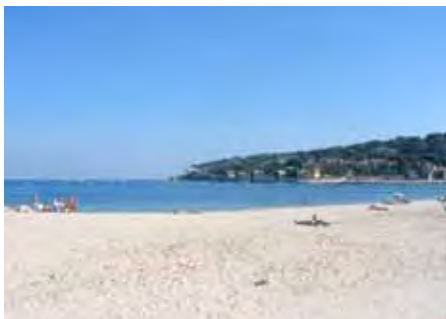
Der Strand von Antibes