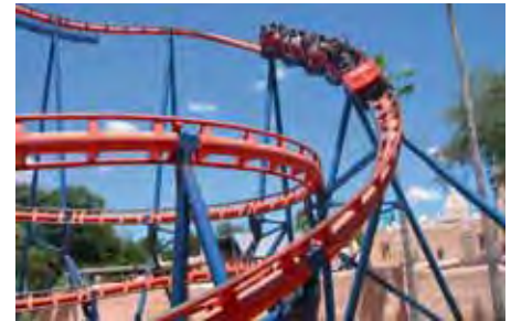
Besuch eines Freizeitparks