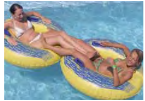
Chillen am Pool

Ausflüge. Am Wochenende können Ausflüge beispielsweise nach Disney World und Sea World, zu den Universal Studios oder ins Kennedy Space Center gebucht werden. Auch ein Snorkling Trip zu den Korallenriffen ist im Angebot. Diese zusätzlichen Ausflüge finden vorbehaltlich ausreichender Teilnehmerzahl statt – Kosten ca. 70 $ für Halbtags- und 140 $ für Tagesausflüge.