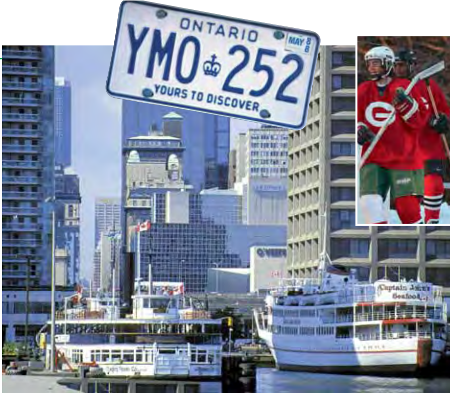
Kanada – unberührte Natur und interessante Großstädte

Regionale Wünsche Kanada ist – wie Deutschland – ein Bundesstaat mit Ländern bzw. “Provinzen” mit eigenen Regierungen. Erziehung und Kultur sind Sache jeder einzelnen Provinz. Die meisten unserer Teilnehmer gehen in den Provinzen Ontario, British Columbia, Manitoba und Alberta zur Schule. Auf Wunsch kommen auch andere Provinzen in Betracht wie z.B. das französischsprachige Québec.