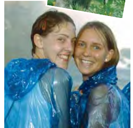
Ausflug zu den Niagara-Fällen