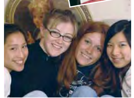
In der Schule findet man rasch neue Freunde.