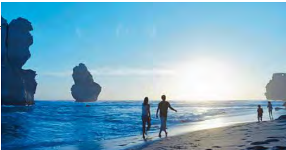
Victorias weite Strände laden zu Spaziergängen ein

Zur Schule in Melbourne Weltklasse-Events, trendy Boutiques, internationale Kunst- und Kulturszene. Melbourne ist nicht nur Kultur- und Sporthauptstadt Australiens, sondern mit über 100 Golfplätzen auch das Mekka der australischen Golfer. Mit Mindesttemperaturen von 10 Grad im Winter und 20 Grad im Sommer ähnelt das Klima in Melbourne dem in Spanien.