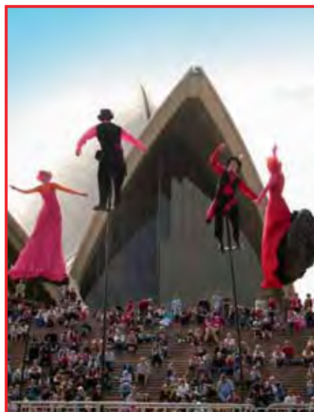
...und internationale Kunstszene

Die Aussies Staatsoberhaupt von Australien ist die englische Königin. Von britischer Steifheit merkt man im australischen Alltag aber nicht allzu viel. Im Gegenteil: Wenn man da ist, entpuppt sich der Australian Way of Life als eine lässige Verbindung von europäischem, asiatischem und amerikanischem Lebensstil. Entsprechend locker ist der Umgangston und häufig wird man auch von Unbekannten mit dem typisch australischen G'day mate (Tag Kamerad) begrüßt. Selbst Fremden gegenüber ist man aufgeschlossen und interessiert und behandelt sie wie alte Bekannte.