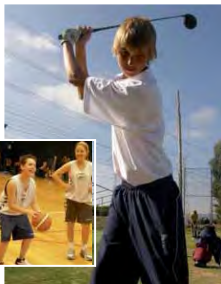
Golf als Schulfach

Einrichtungen: großes Hallenbad, Sporthallen, Basket- und Footballstadion, Theatersaal, Bibliotheken, IT- und Foto-Labors, Räume für darstellende und bildende Kunst, Ballsaal, Kunsträume