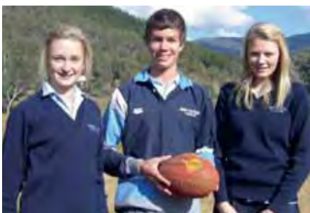
Football in den Australian Alps

Empfohlene Schulen Für unser australisches Schuljahr stehen vier Schulen in drei verschiedenen Regionen von Victoria zur Wahl, die uns vom Erziehungsministerium speziell empfohlen wurden. Sie unterscheiden sich vor allem durch unterschiedliche Unterrichts- und Freizeitangebote. Bei jeder Schule sind nachstehend nur die speziellen Angebote genannt, nicht die üblichen Fächer. Neben den beschriebenen Schulen kann auch jede andere Sekundarschule für das Internationale Schuljahr gewählt werden. Australische Schüler sind aufgeschlossen und kontaktfreudig, so dass es kein Problem ist, rasch Freunde zu finden. Auf dem Weg zur Schule wird man von den Busfahrern schon morgens mit einem gut gelaunten G'day mate begrüßt, für das man sich beim Aussteigen mit einem ebenso freundlichen Catch Yah, See you later oder Thanks man revanchieren kann.