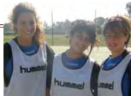
Girls Soccer in Rowville

Klassenstufen: 7-12 Anzahl Schüler: 1750 Schuluniform: ja Internet: rowville.vic.edu.au