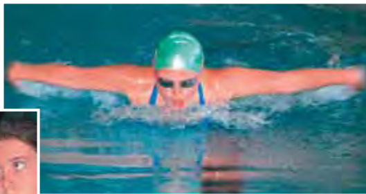
...ideal zum Schwimmen und Surfen