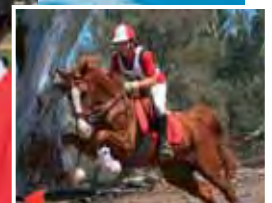
...liegt auf dem Rücken der Pferde